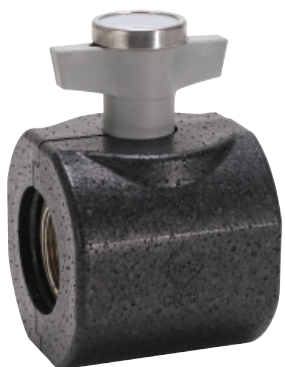
Wärmedämmschalen für ISO-T Griff heating insulation boxes for ISO-T handle ( siehe Datenblatt 1.1.6.0.2 ) ( see data sheet 1.1.6.0.2 )