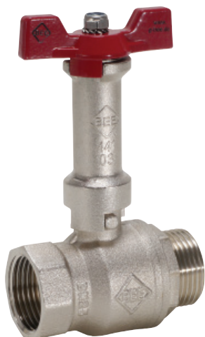
Spindelverlängerung 441 Stem extension 441 ( siehe Datenblatt 1.1.10.3 ) ( see data sheet 1.1.10.3 )