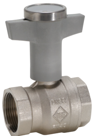
Nachrüstset Thermometer für ISO-T Griff mounting kit thermometer for ISO-T handle ( siehe Datenblatt 1.1.6.0.1 ) ( see data sheet 1.1.6.0.1 )