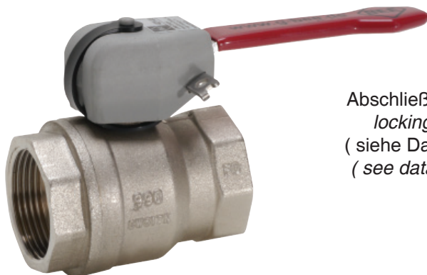
Abschließvorrichtung 421 locking device 421 ( siehe Datenblatt 1.1.10.1.1 ) ( see data sheet 1.1.10.1.1 )